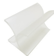
④アクリルスタンド

箱を開けてすぐにご確認ください。不足している場合は、サポートセンターまでご連絡ください。